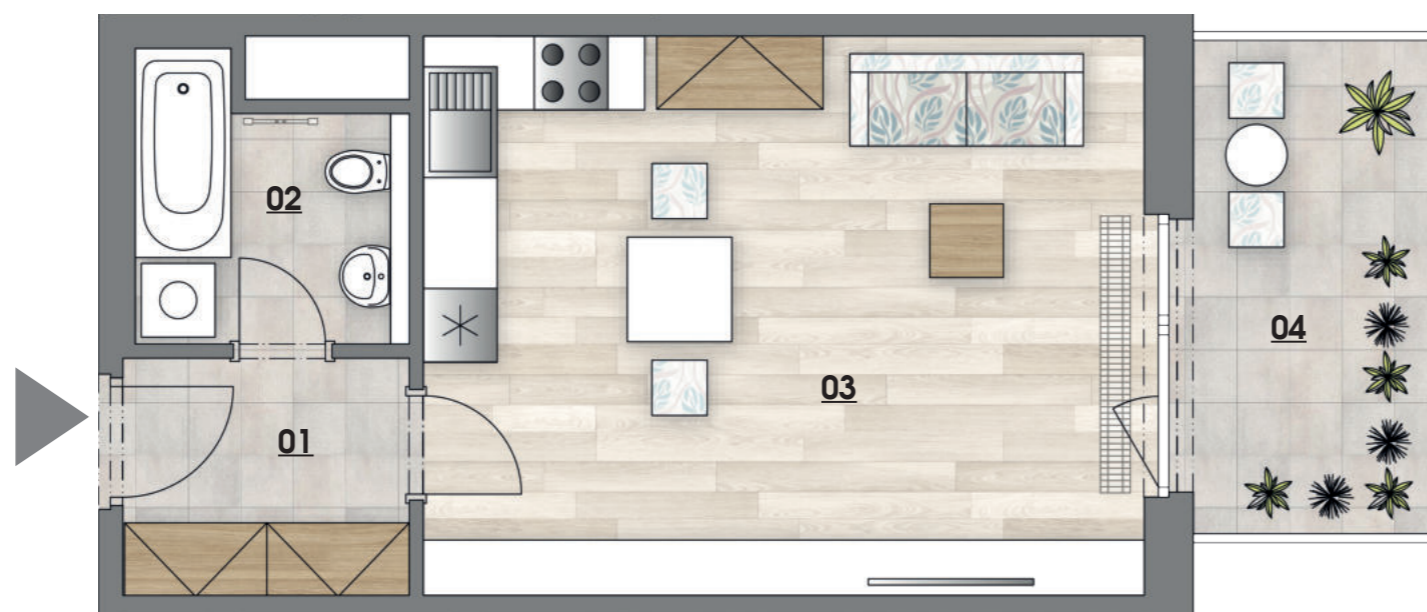
SITUACE | SEKCE 1 | 2.NP